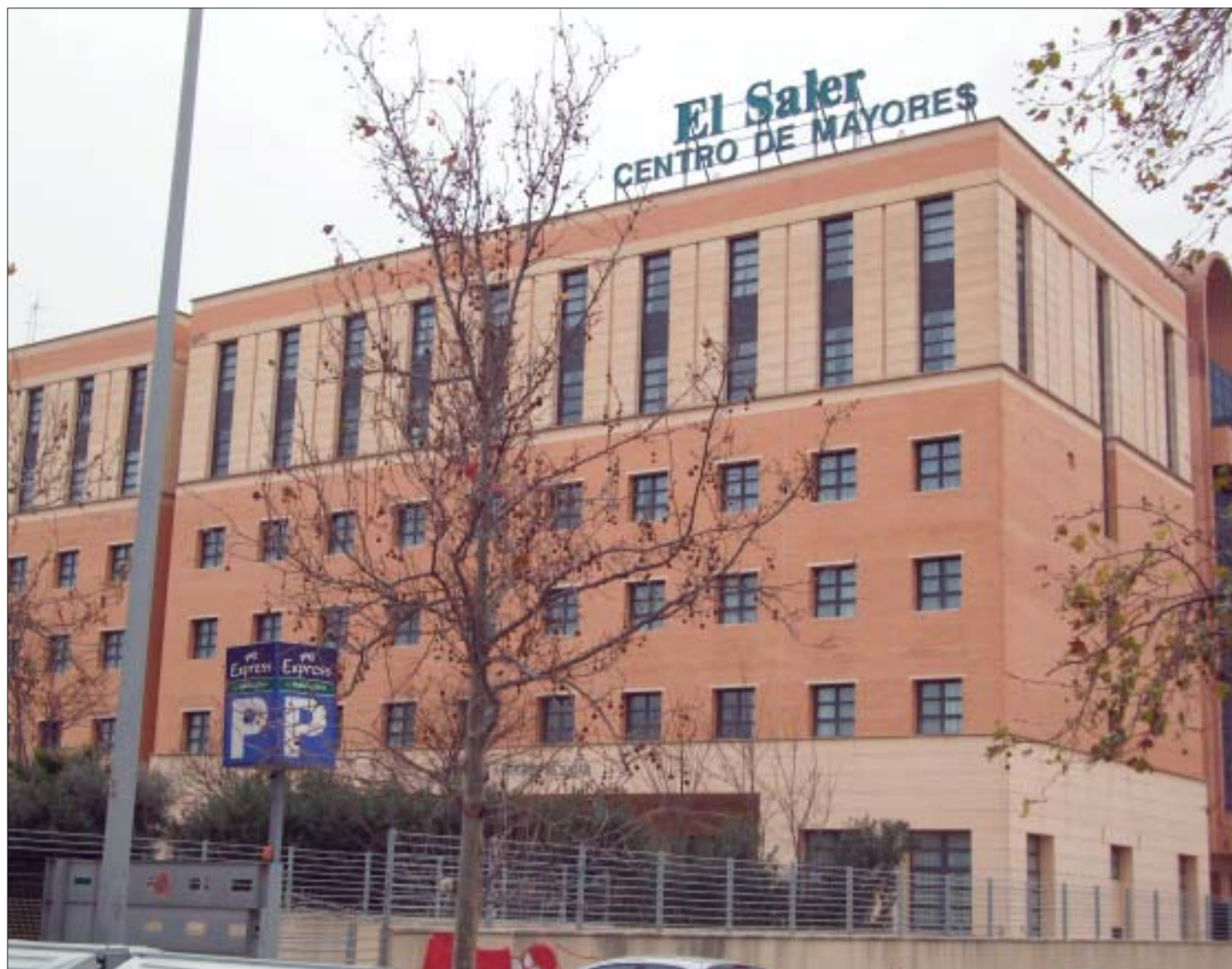
El Centro de Mayores El Saler cuenta con unas inmejorables instalaciones.